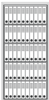
FLC 195 / 92